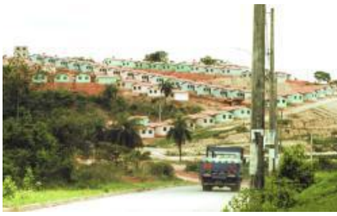
图为维拉班代拉韦尔梅利亚社区

此外，工人联盟还认识到，不仅要在工作场所发起斗争，还要在工人居住的地方发起斗争的重要性。由于联盟在土木建筑工人方面有很强的基础，他们能够解决人民的一个直接需求：住房。1995年，一个贝洛奥里藏特社区从争夺土地的激烈斗争中建立起来，并命名为“维拉科伦比亚（Vila Corumbiara。译注，意为科伦比亚万岁）”，以纪念圣埃莉娜的斗争。1999年，另一个名为“维拉班代拉韦尔梅利亚（Vila Bandeira Vermelha。译注，意为红旗万岁）”的社区在贝廷建成，贝廷是贝洛奥里藏特郊区的一个城市。