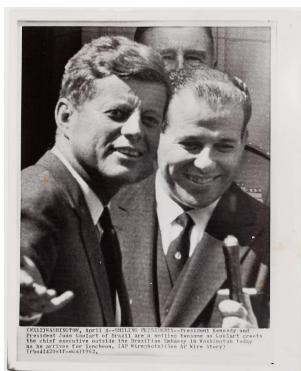
古拉特和肯尼迪在政变前几个月

1958年，巴西革命斗争受到了巴共战略转变的影响。巴共的战略向右转向了赫鲁晓夫“和平过渡”路线和为生产力理论作辩护。这导致了1962年修正主义者和革命者的分裂。农村主要由革命党人控制，他们通过重新提出武装斗争的必要性使农民运动激化，而城市则由修正主义的巴共控制。巴共开始主要关注政党合法化的道路，他们战略上的改变导致了工人运动的平息。